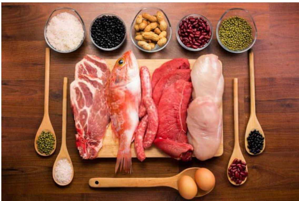
Chế độ dinh dưỡng hợp lý giúp chăm sóc trẻ em từ bên trong