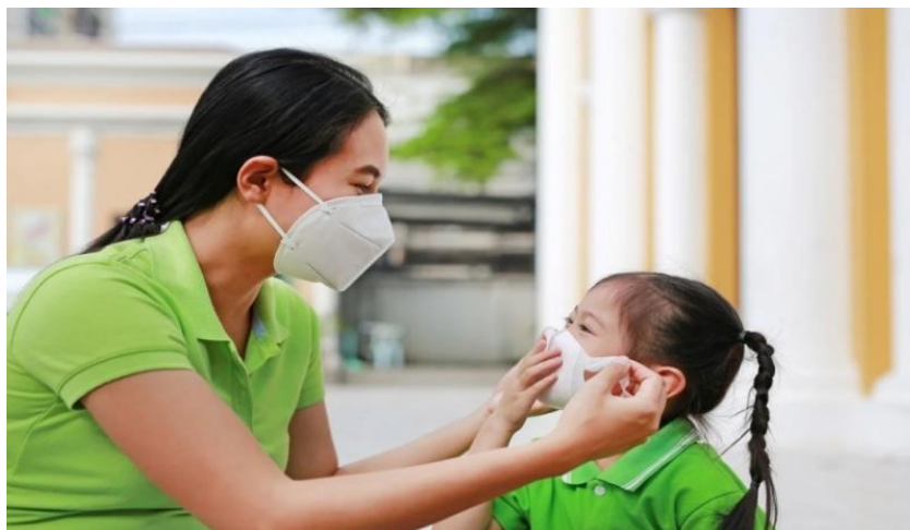
Đeo khẩu trang là một cách chăm sóc trẻ em trong mùa dịch

Để giảm bớt nguy cơ lây nhiễm Corona (COVID-19), chăm sóc trẻ em tốt hơn, ba mẹ cần đảm bảo vệ sinh sạch sẽ môi trường xung quanh. Nơi sinh hoạt của các bé phải được tiệt trùng, lau chùi thường xuyên. Bên cạnh đó, ba mẹ có thể hạn chế nguy cơ nhiễm bệnh do tiếp xúc bề mặt bằng cách vệ sinh các vật dụng, đồ chơi của bé, những vị trí nhiều người chạm vào như tay nắm cửa, nên dùng chất cồn hoặc dung dịch kháng khuẩn để loại bỏ tối đa các loại virus, vi khuẩn bám vào.