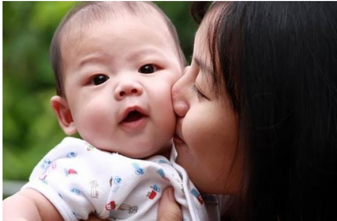
Tránh ôm hôn trẻ để phòng lây nhiễm bệnh

Những hành động như ôm ấp, hôn trẻ có thể khiến trẻ dính phải các giọt bắn nước bọt từ người mang mầm bệnh, dù họ chưa có biểu hiện phát bệnh như ho, sốt. Cho nên ba mẹ cần hạn chế cho trẻ tiếp nhận những hành động đó. Ba mẹ nên hạn chế cho bé đến những nơi tập trung đông người, cố gắng sắp xếp thời gian vui chơi và học tập cùng bé tại nhà.